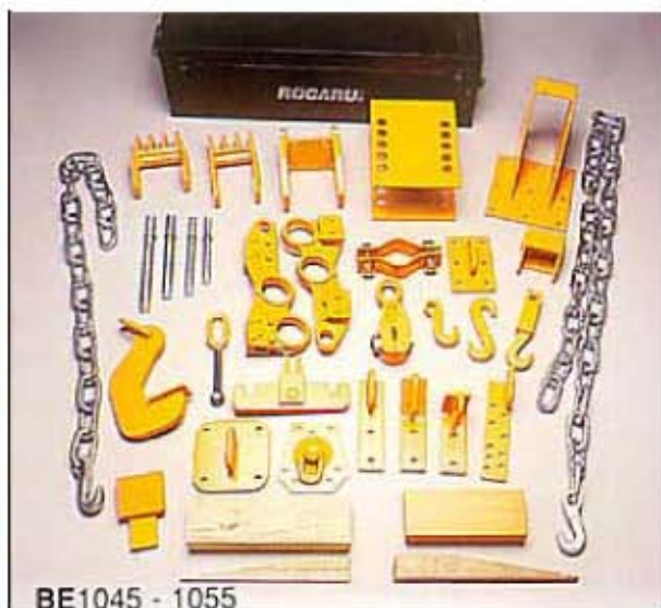
BE1045 - 1055